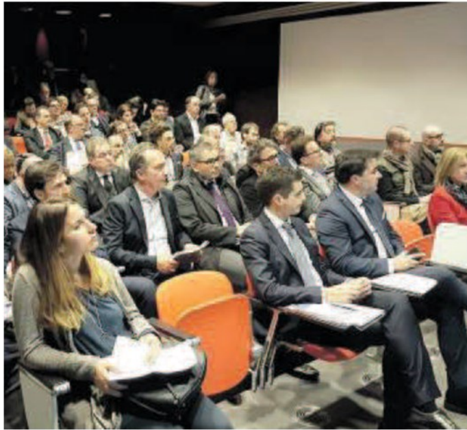
L'accordo tra Confindustria e Intesa Sanpaolo presentata ieri, a Fabriano, presso la sede di Elica