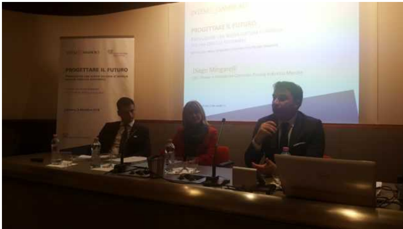
Il tavolo della presidenza

FABRIANO – Siglato a Fabriano , all'interno dell'auditorium di Elica , azienda leader nel settore delle cappe aspiranti, l' accordo fra Intesa Sanpaolo e Confindustria Piccola Impresa . A disposizione un plafond di 2,6 miliardi per le Pmi marchigiane attraverso l'iniziativa Progettare il futuro dedicata alla competitività e alla trasformazione delle imprese per cogliere l'opportunità offerte dalla quarta rivoluzione industriale. Il tutto, attraverso l'individuazione delle soluzioni e degli strumenti migliori per il rafforzamento aziendale.