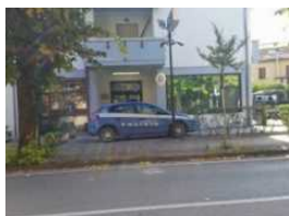
Fabriano: licenza sospesa, locale multato