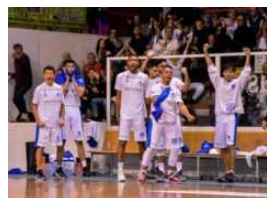
Ristopro Fabriano, una vittoria costruita con tanti mattoncini